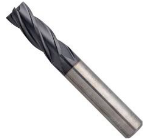
機械加工用消耗品