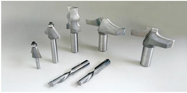
当社の取り扱う製造品および再研磨品