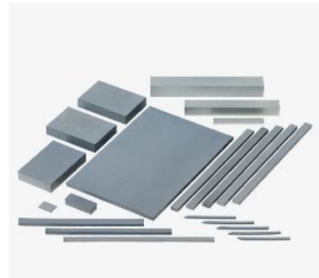
製造品用超硬合金(刃物素材)在庫