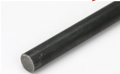
製造品用鉄材等在庫